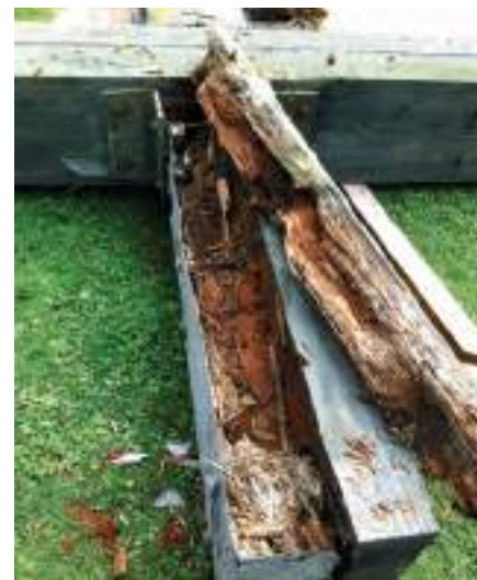
Ajahammas on kõvasti puitu purenud.