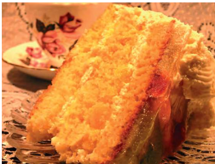
Whip-cream pineapple cake with glazed fruit topping.

The cookbook will include traditional Estonian recipes, those that are tried and true, as well as new favourites. Cooking and serving tips, photographs, as well as short prayers (grace before meals) will be included. To be written in English, we are aiming to have it completed and printed for the fall of 2019.