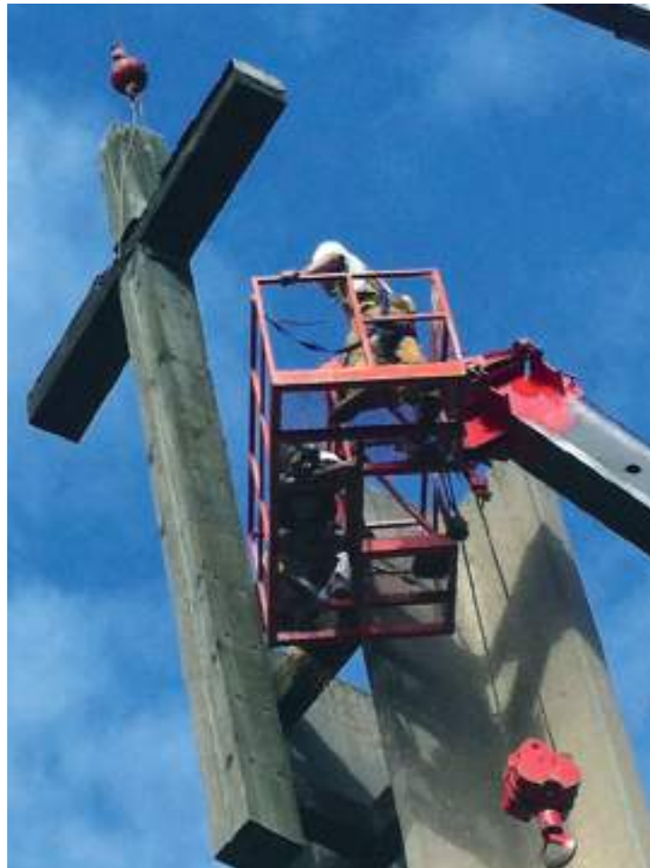
Töömehed risti juures.