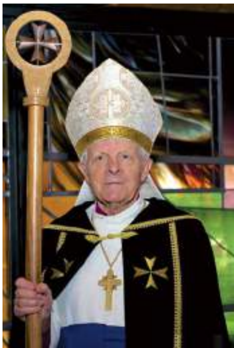
Andres Taul teenis kogudust 1982–2011, 2007. a valiti ta E.E.L.K. peapiiskopiks ning jäi piiskopi ametist emerituuri alles 2017. a.