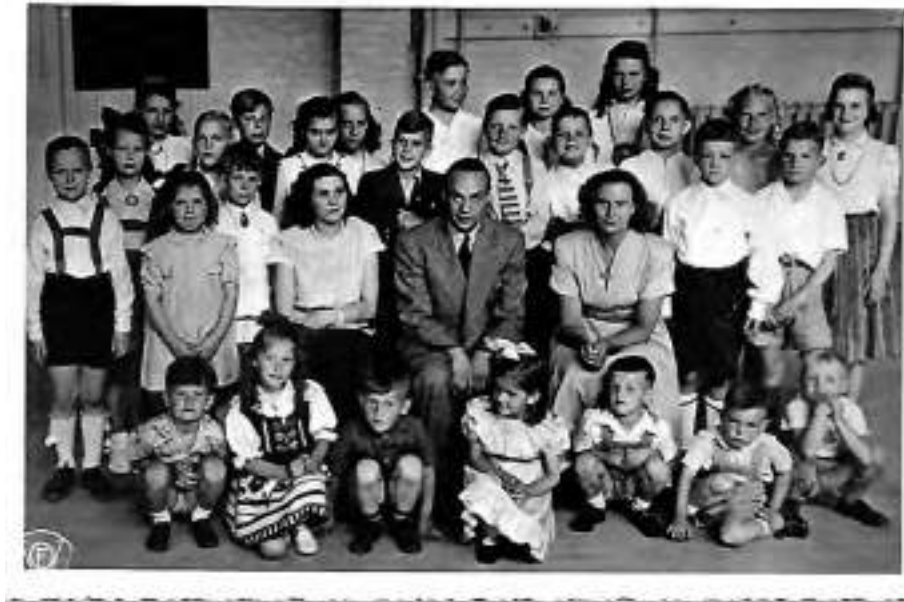
12. juuni 1949 – pühapäevakooli esimene lõpupidu.