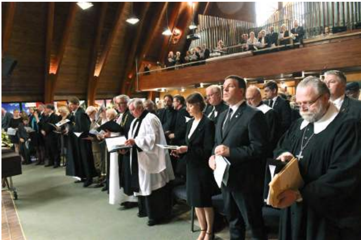
Ülemkarjasega jumalagajätuks kogunes kirikutäis kogudust lähedalt ja kaugelt.