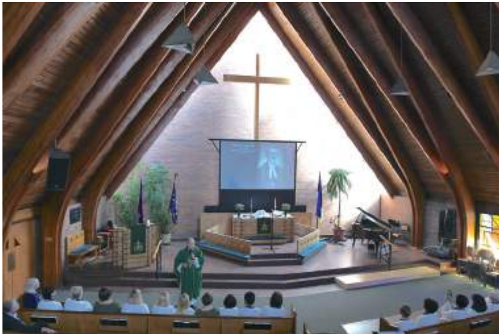
Aastapäeva jutlust illustreerisid pildid.