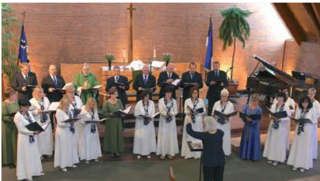
Ühendkoor – Viljandi Pauluse ja Toronto Peetri lauljad üheskoos.