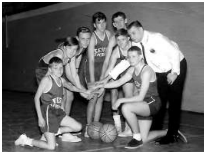
Koguduse korvpallimeeskond 1965.

1982. a sai kogudus oma ajaloo teise õpetaja. Andres Taul teenis kogudust 1982–2011 ning jätkas osalise koormusega teenimist veel 2014. a kevadeni. Ta valiti 2007. a E.E.L.K. peapiiskopiks ning jäi piiskopi ametist emerituuri alles