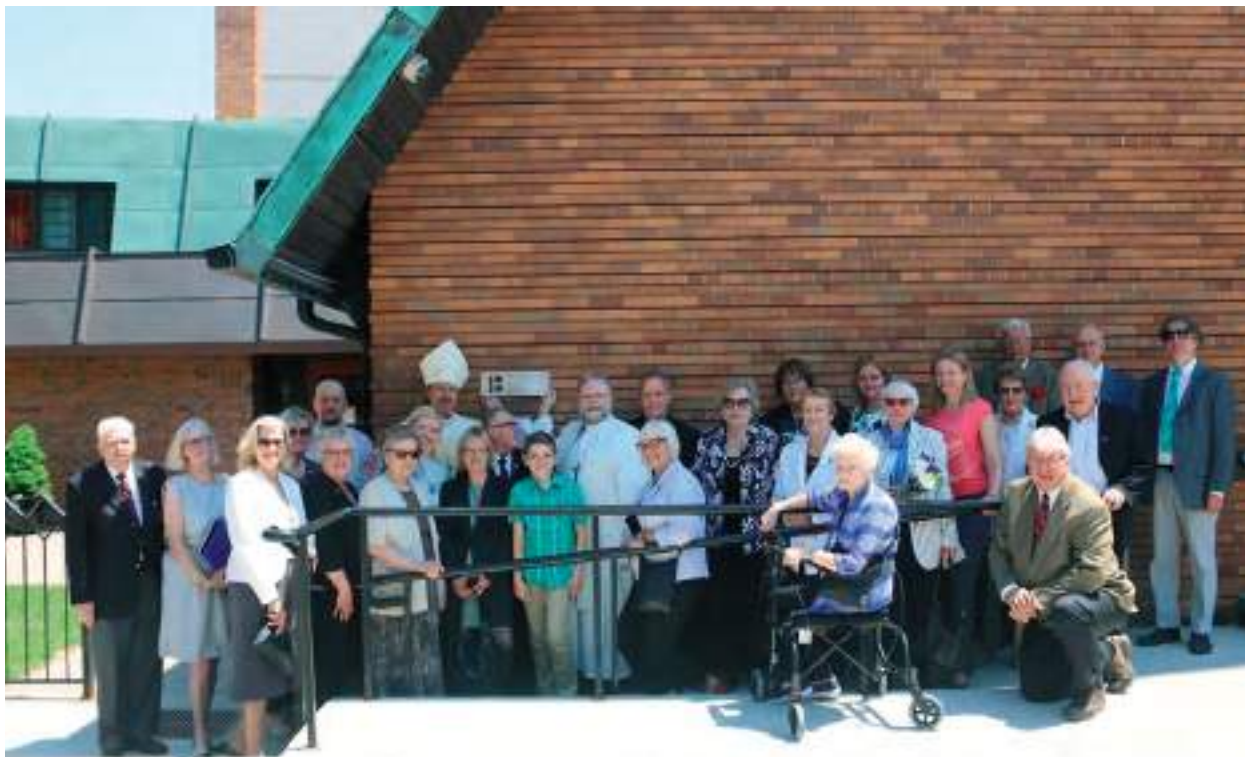
Pühapäeval, 27. mail toimunud jumalateenistuse lõpus avas peapiiskop Urmas Viilma Toronto Peetri kiriku seinal väärrika mälestusplaadi „Eesti Vabariik 100 Torontos“. Pildile on jäänud kõik selle pühapäeva kirikulised. Tiit Pruuli

Selle külaskäigu raames toimunud pidulikul vastuvõtul andis vabariigi peaminister EELK Toronto Peetri kogudusele üle Eesti Vabariigi juubeli mälestusplaadi, millel on tekst: „Eesti Vabariik 100 Torontos“ ning visiidi kuupäev 26. mai 2018.