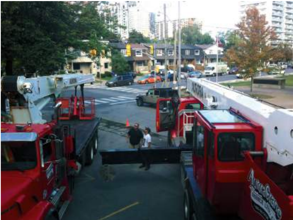
Kraana ja tõstuk seatakse paika.