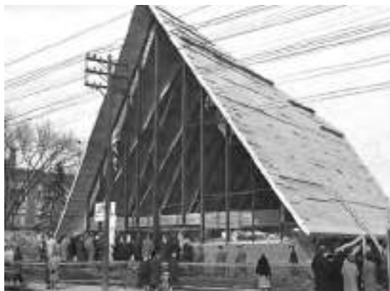
Toronto Peetri kirik ehitusstaadiumis.

Aga ka see aeg on meile antud Jumala käest. Ning ikka pühapäevast pühapäeva on see koda avatud ja kõik on oodatud. Selleks ka, et meenutada kunagisi aegu, kuid sellekski, et otsida seda osadust Jumalaga, mis püsib üle kõikide aegade.