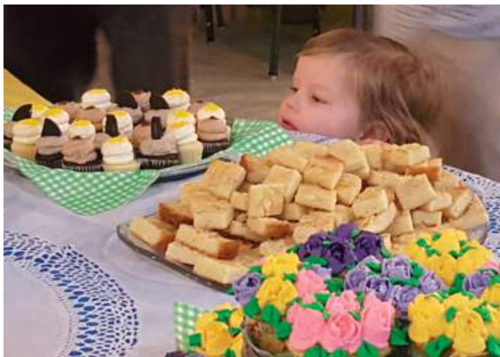
Üks väike osavõtja tundis kookide vastu suurt huvi.