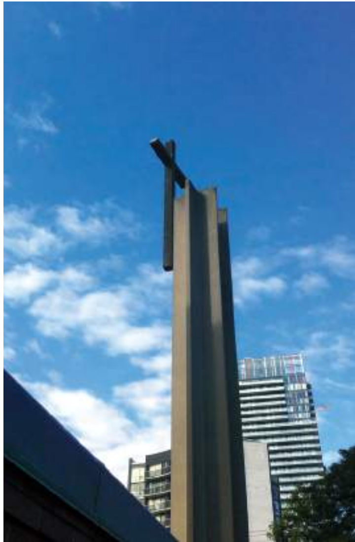
Viimased hetked enne risti demonteerimist.

Tõstkem rist õnnistama kõiki, kes meie kirikusse tulevad, ja saatma neid, kes siit lähevad.