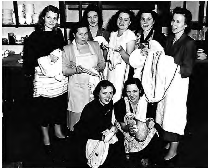
Koguduse perenaised 1949.

Sõjakeerises läks ta Soome ning teenis Eesti vabatahtlike rügemendis JR/200 sõjaväekaplanina. 1944 põgenes ta Rootsi, kust läks 1947 USAsse. Oma esimese päris püsiva koguduse saigi ta alles Torontos, kust läks emerituuri aastal 1982. Peetri koguduse teenimisest sai tema elutöö.