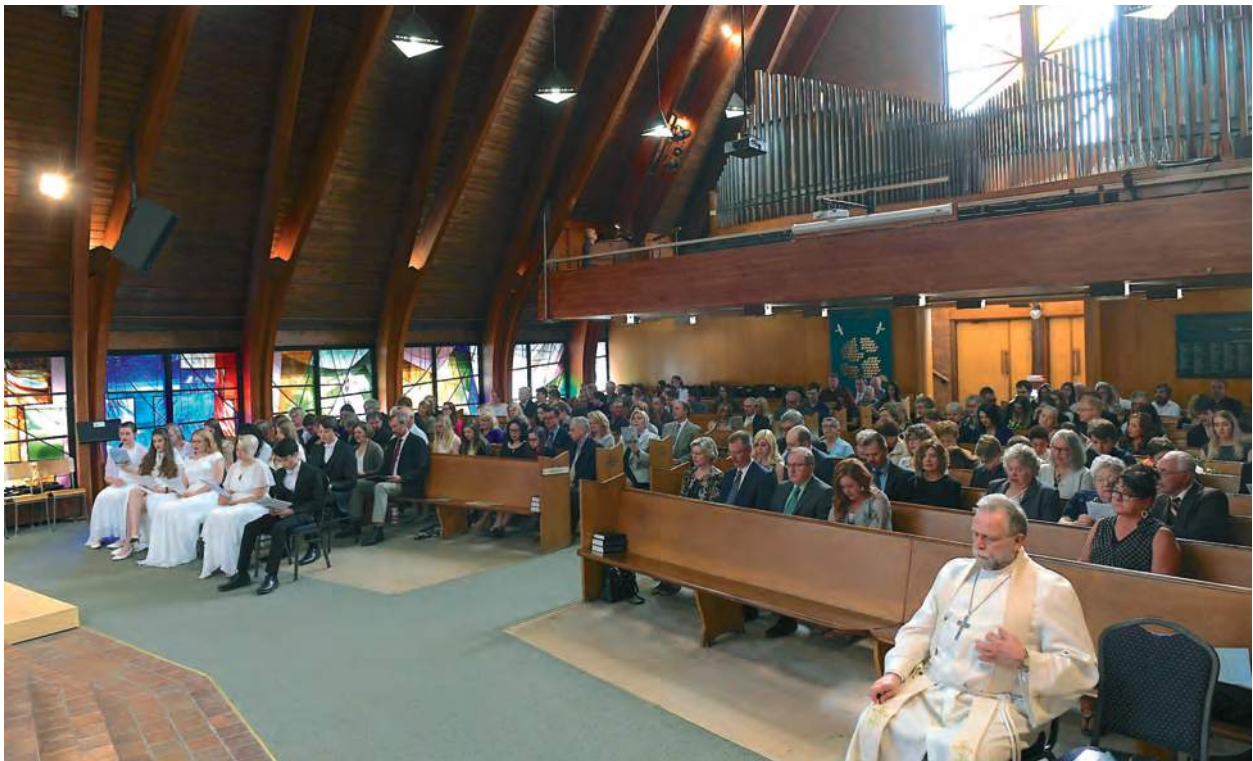
Leeripüha kogudus oli rohkearvuline.