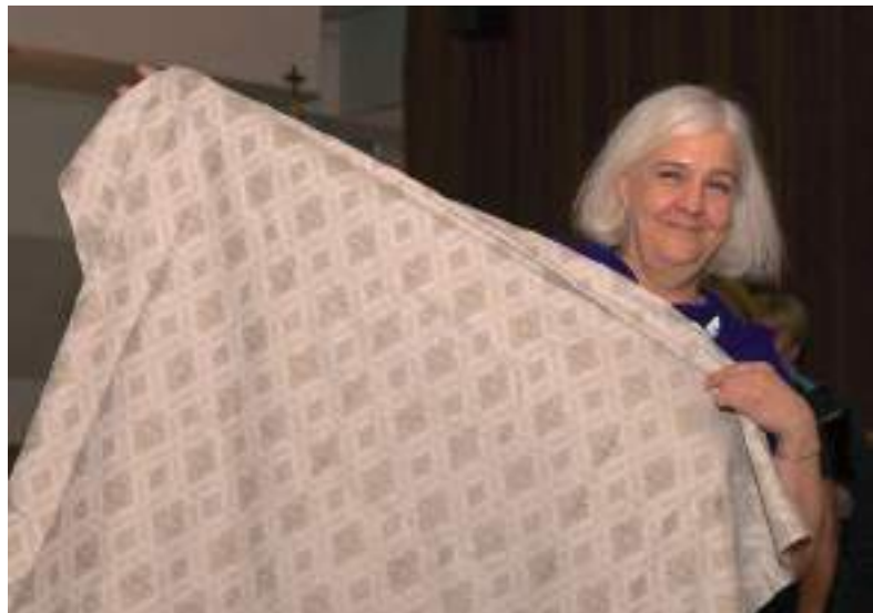
Viljandi koori kingitud kaheksakand- mustriga laudlina.