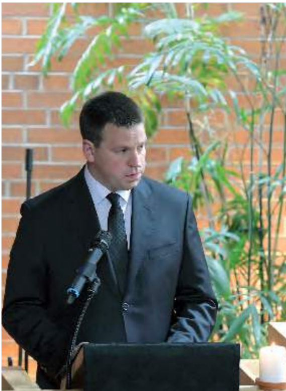
Peaminister Jüri Ratas pidas ilusa kaastundekõne Eesti valitsuse nimel.