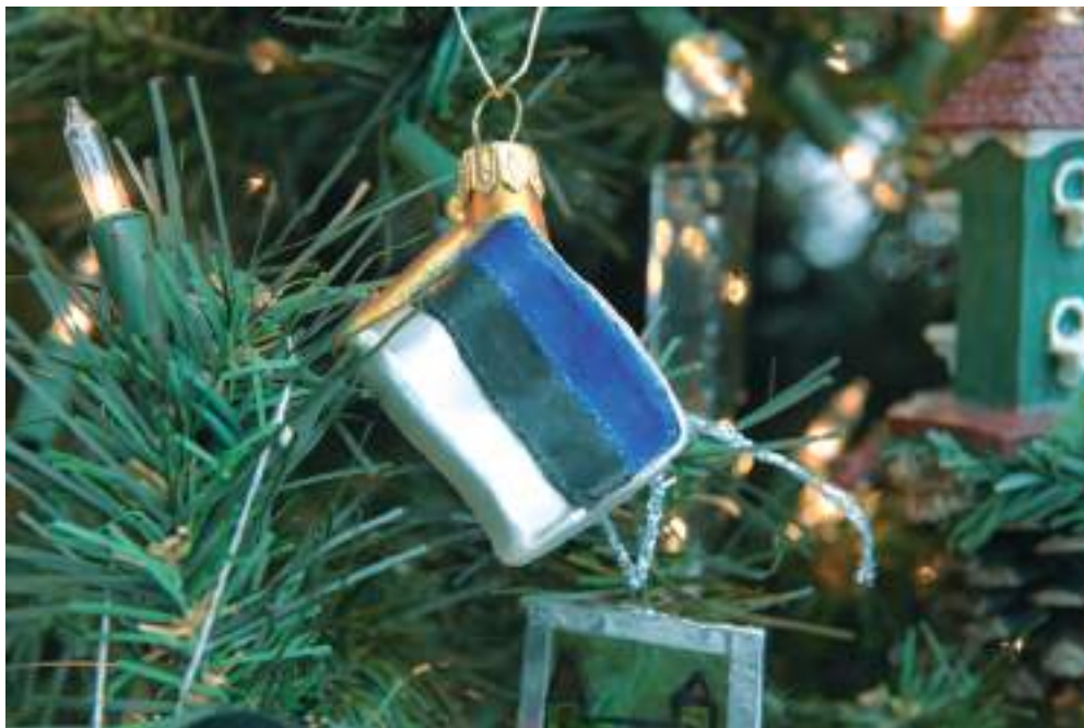
Eesti rahvusvärvid jõulupuul.