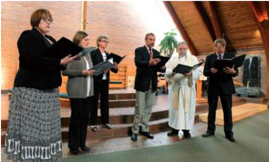
Laulis koguduse vokaalansambel.