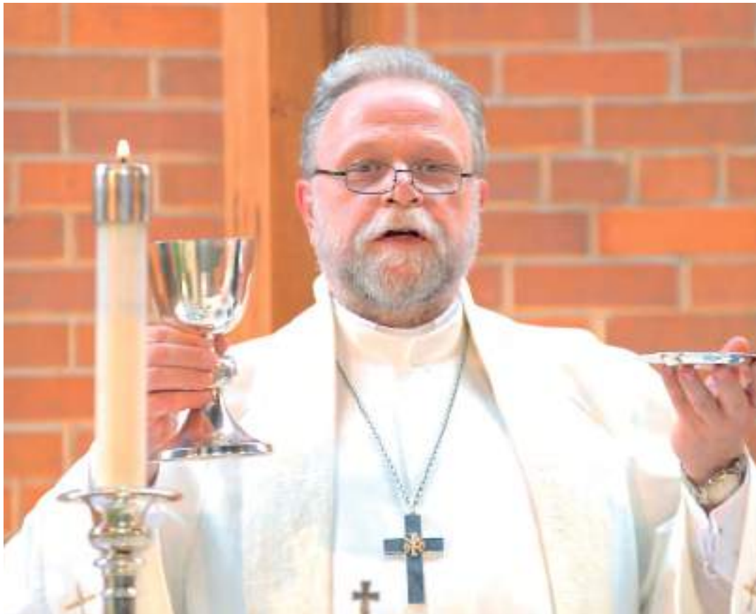
Tulge, sest kõik on ju valmis.