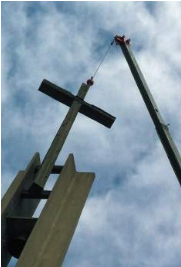
Algab ettevaatlik langetamine.