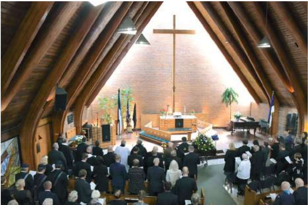
Altari kõrvale olid matusetalituseks asetatud EÜS-i, EELK ja skaudimaleva lipud (vasakul), lisaks soomepoiste lipp, mis on oma alalisel aukohal Peetri kirikus (paremal).