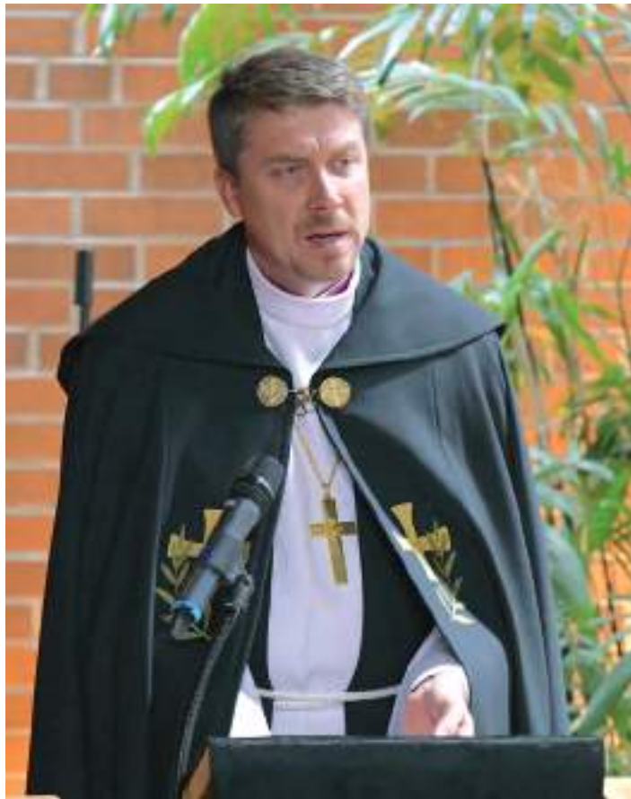
Matusekõne pidas peapiiskop Urmas Viilma.