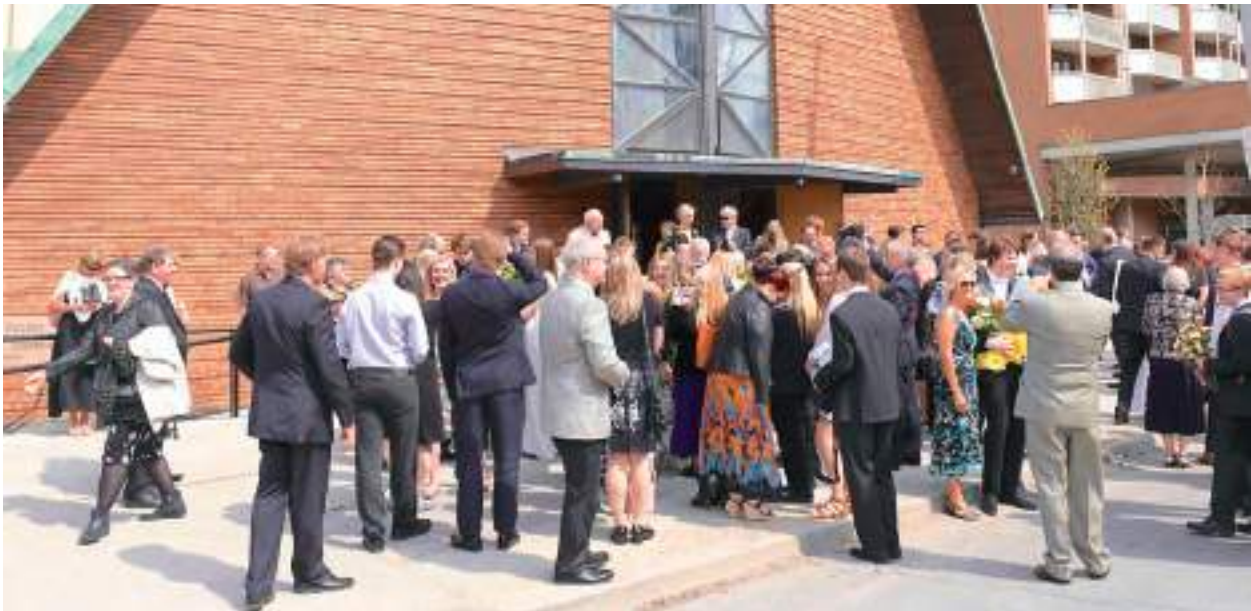
Ootajaid jätkus ka kiriku ette.