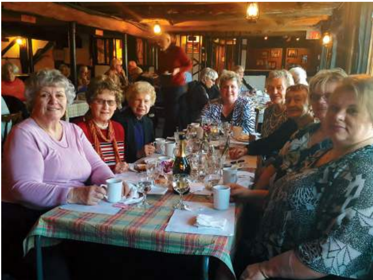
Aprillikuus oli naisringi väljasõit. Külastasime Herongate Barni teatrit. Hea toit ja lõbus ettekanne, aga kõige tähtsam – omavahelise sõpruse kinnitamine.