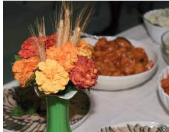
Pidulaua kaunistas Lehta Greenbaum koos abilistega.