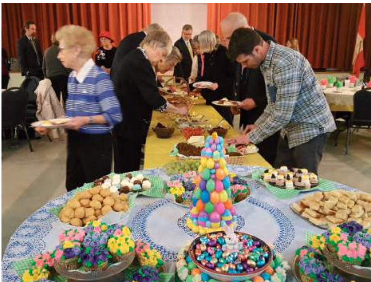
Alustasime aastat langenute mälestamisega 1. aprillil. Naisring valmistas koguduse ülestõusmispüha brunch'i .