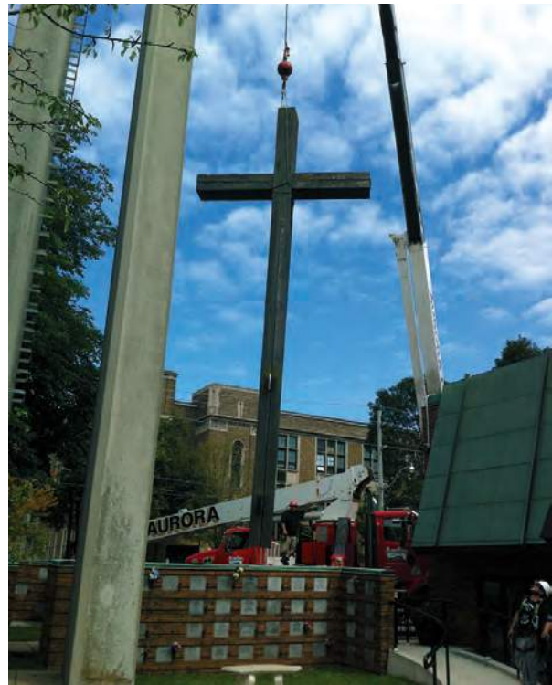
Poolle teel maapinnale.