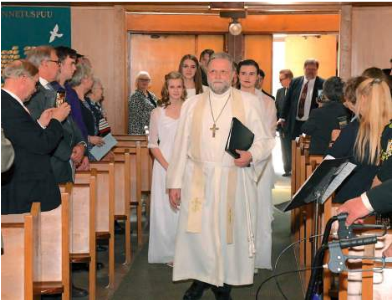
Pühakojas ootas kogudus leerilapsi.

- Oleks vaja rohkem leeritunde, piiblitunde ja diskussioone korraldada.