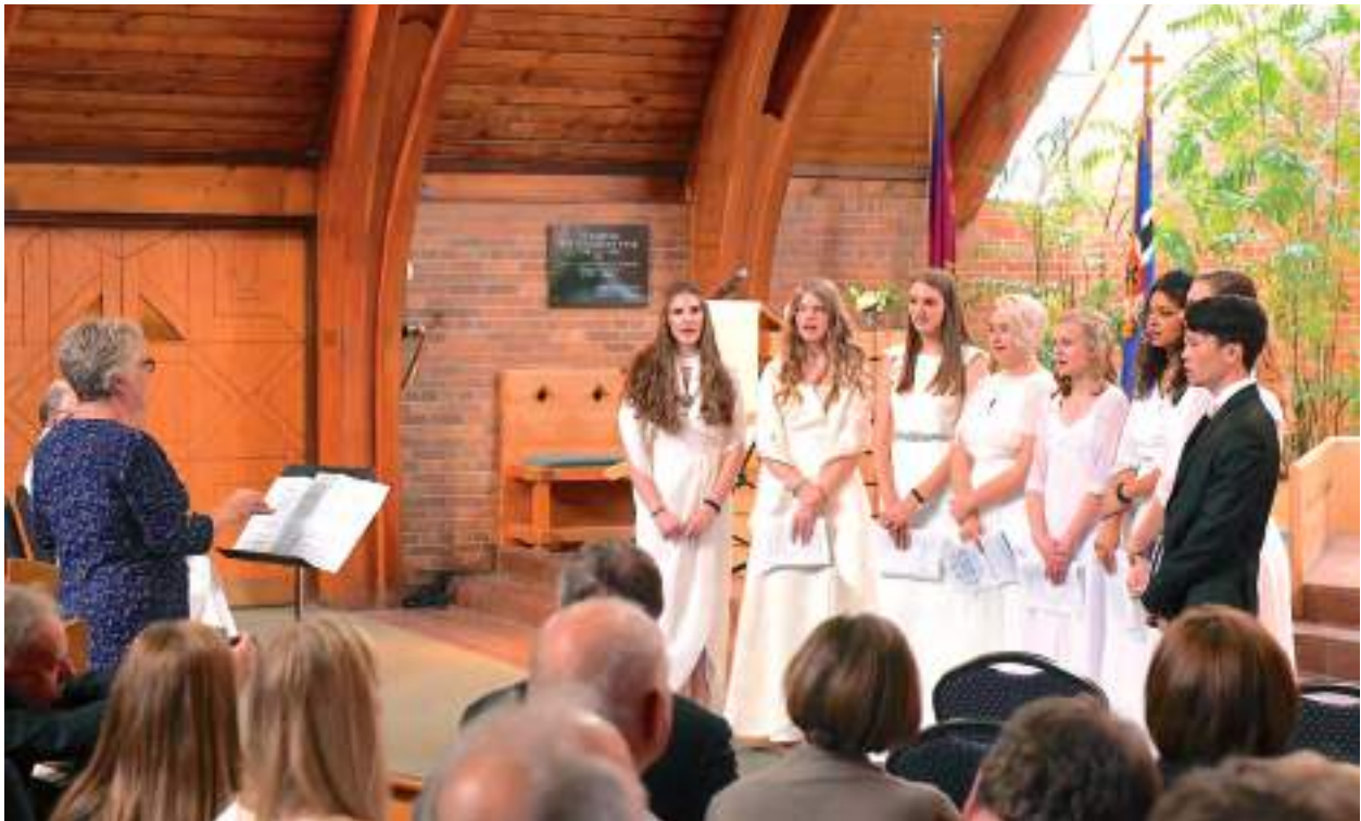
See leerigrupp oskas laulda.