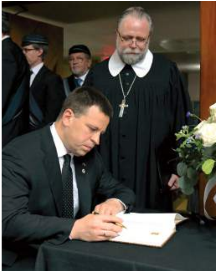
Peaminister Jüri Ratas jättis kaastundeavalduse peapiiskop emeeritus Andres Tauli mälestusraamatusse.