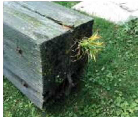
Risti tipus kasvas mais.