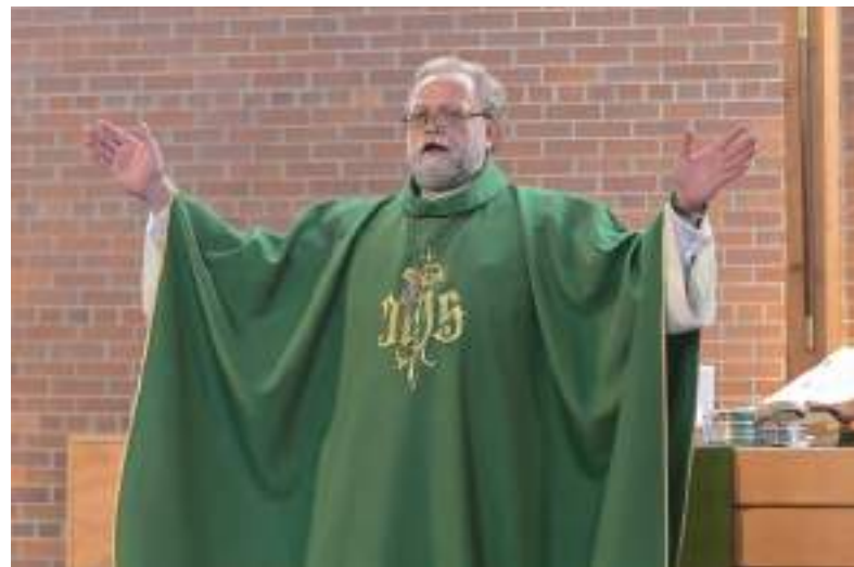
Viljandlaste kingitud roheline kaasula (rüü, mida vaimulik kannab armu- laua pühitsemisel).