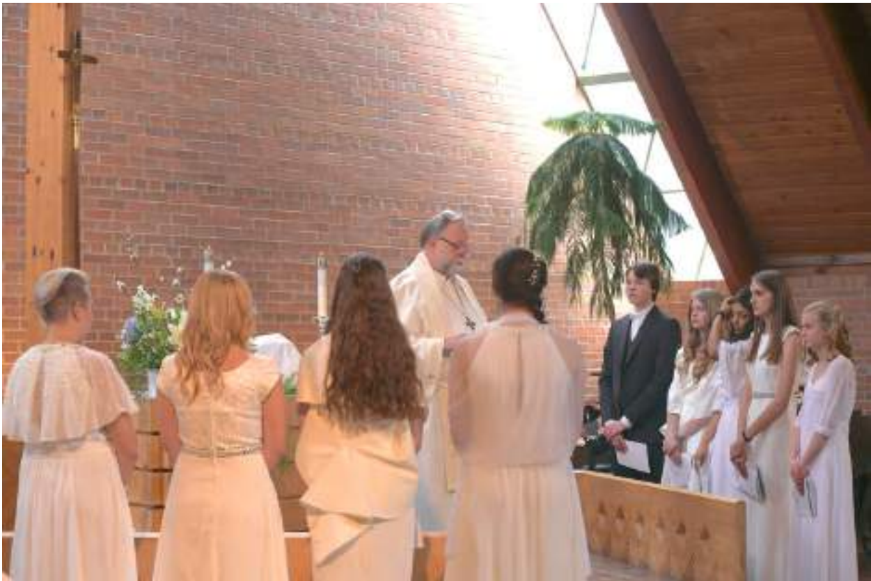
Noored annavad leeritõotuse.

- Loodan, et ta on saanud innustust rohkem usuelust õppida ja et tema usk süveneb.