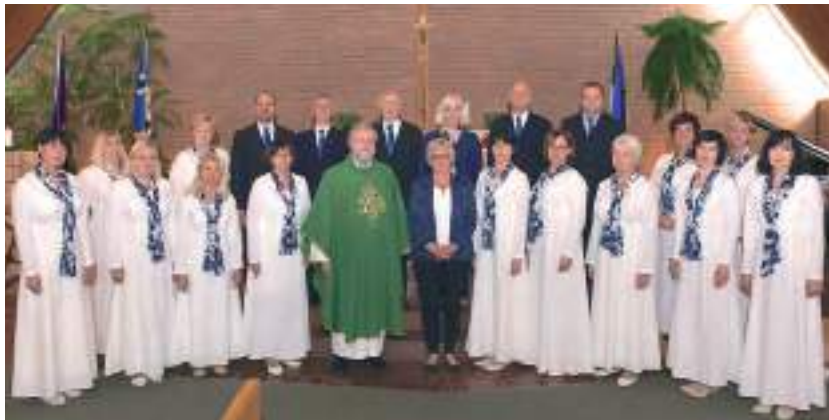
Laulis Viljandi Pauluse koguduse segakoor.