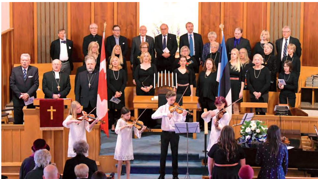
Su üle Jumal valvaku.